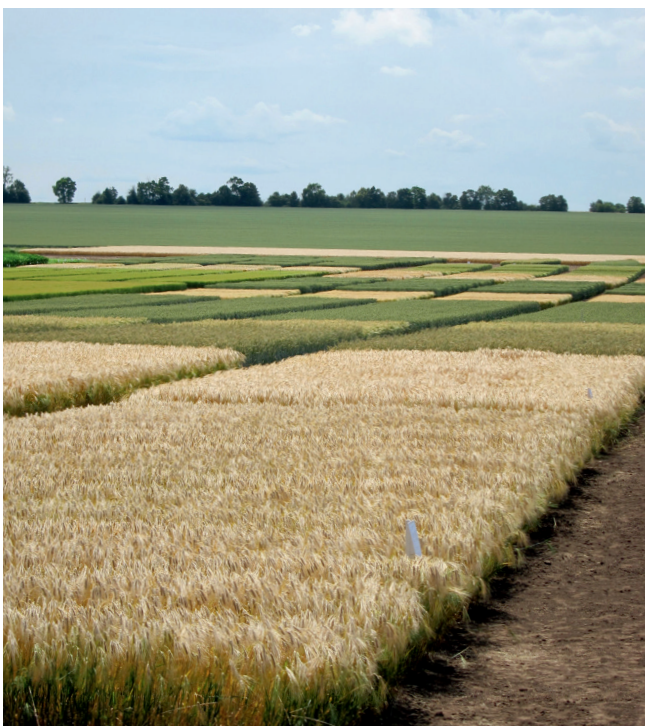
Die Pflanzenzüchtung arbeitet mit Hochdruck daran, neue innovative Sorten für die Landwirte zu entwickeln.

Die Anhaltspunktentscheidung bleibt durch das „Vogel-Urteil“ unberührt. Siehe dazu auch „Rechte und Pflichten ... der Landwirte“ (Seite 9).