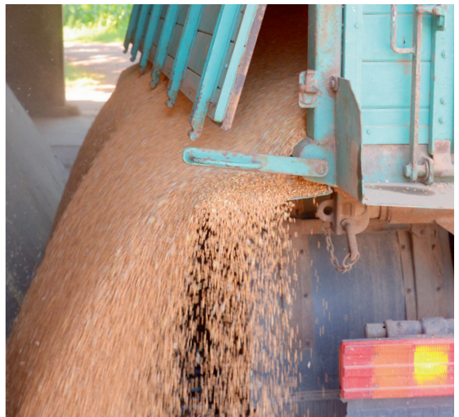
Die Erntegut-Entscheidung betrifft alle Landwirtinnen und Landwirte, die geschützte Pflanzensorten anbauen.

Nachbau ist immer dann rechtmäßig, wenn eine vollständige Zahlung des betriebenen Nachbaus bis zum 30.06. des betreffenden Wirtschaftsjahres erfolgt. Abgesehen von den Fällen, in